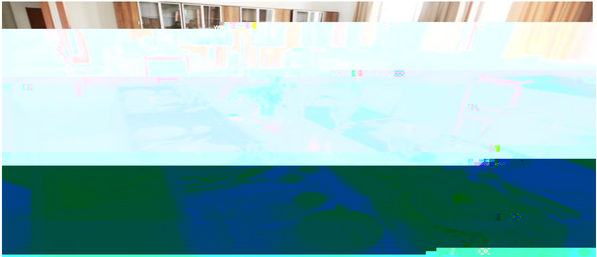
( 餐 4 )